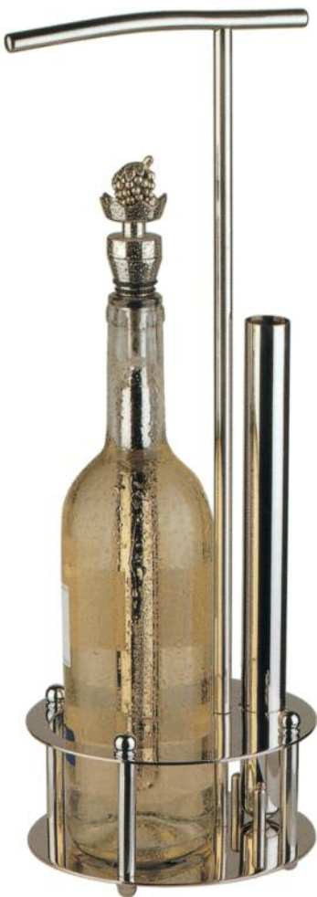
Bandeja para servir el vino.

El Winesceptre. Una herramienta para la Industria de la Hostelería y el Vino y para el hogar.